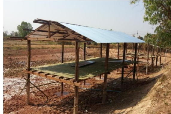
The two chicken coops taken on Feb 7 (below)