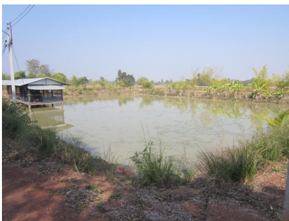
A nearby pond where the water was pumped into