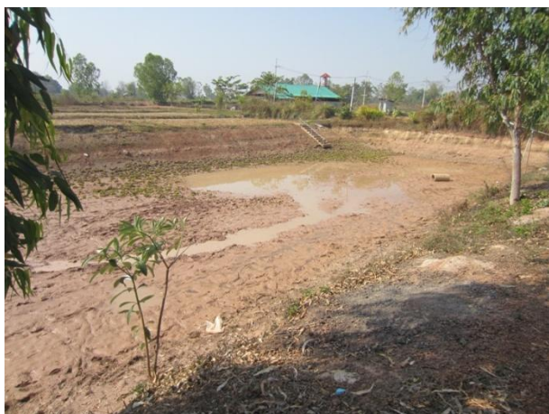
The pond was dried up

We tried to start the project as quickly as possible, but unfortunately, the local construction crews who have good experience in building the chicken coops were not available in January due to church repairs. They promised to start the project in February. While waiting for them we dried up the pond by pumping the water into a nearby pond, and asked the main constructor to buy wood and timbers in the preparatory state.